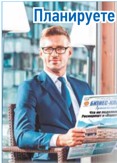
Фото depositphotos.com, Република. Не является публичной офертой.