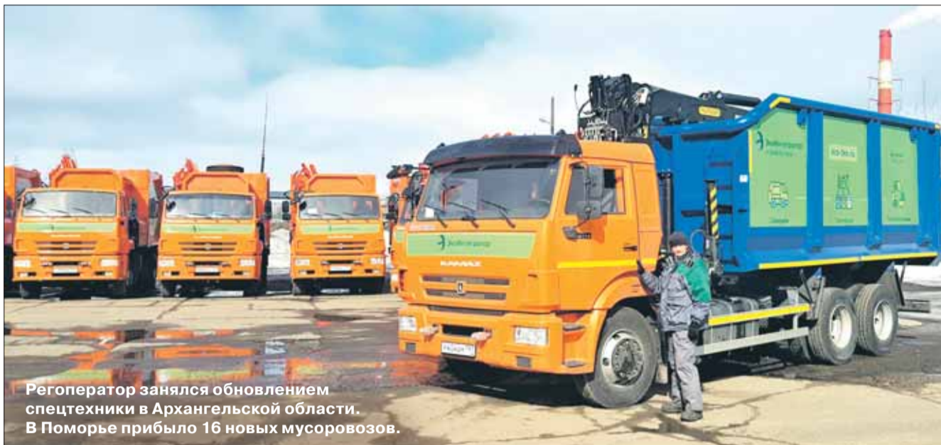
Регоператор занялся обновлением спецтехники в Архангельской области. В Поморье прибыло 16 новых мусоровозов.

Из 16 мусоровозов шесть имеют боковую загрузку, от которой регоператор пока не может отказаться, а девять – заднюю. По мнению руководителя «ЭкоИнтегратора», задняя загрузка позволит организовать процесс на качественно новом уровне и минимизировать загрязнение, остающиеся после работы техники.