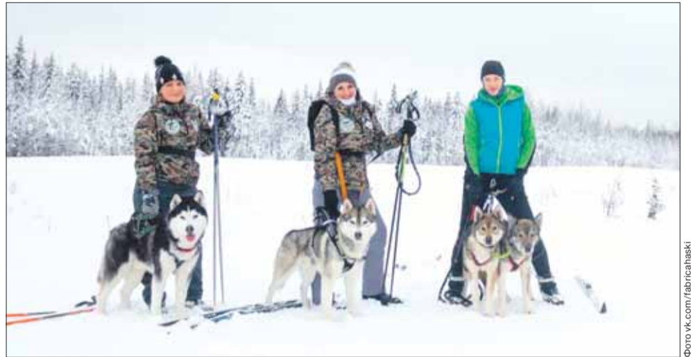
С «Фабрикой Хаски» можно прокатиться не только на собачьих упряжках, но и на лыжах, в том числе в более экстремальном стиле скиджоринг.

тывает и длинные маршруты – на 50 и 100 км. Здесь можно не только прокатиться на собачьих упряжках, но и на лыжах, и даже пройти с собаками в стиле скиджоринг. Но есть и исключения: тут принципиально не берутся за небольшие дистанции на 200-300 метров.