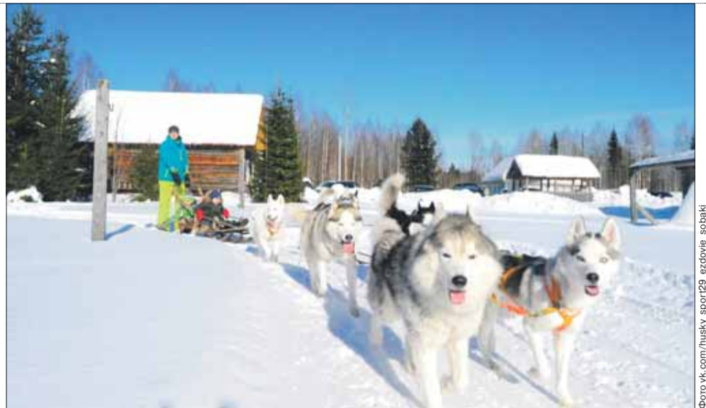
Клуб любителей ездового спорта «Ангелы Севера» ориентирован в большей степени на экспедиции и путешествия, например, по северным деревням.

На территории гостевого дома расположился питомник сибирских и аляскинских хаски. Сейчас здесь живет около тридцати собак, в том числе щенки. «Фабрика Хаски» организует туры от трех километров, разработа-