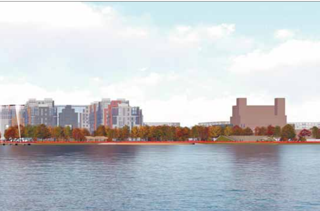
предназначенной для размещения жилья, равен 30%. Сами здания займут только 10%. Остаток территории будет своя детская площадка, зона отдыха, зеленые насаждения и т. д.

«Проект действительно является социальным, поскольку сумма вложений холдинга в городские объекты почти вдвое превыша-