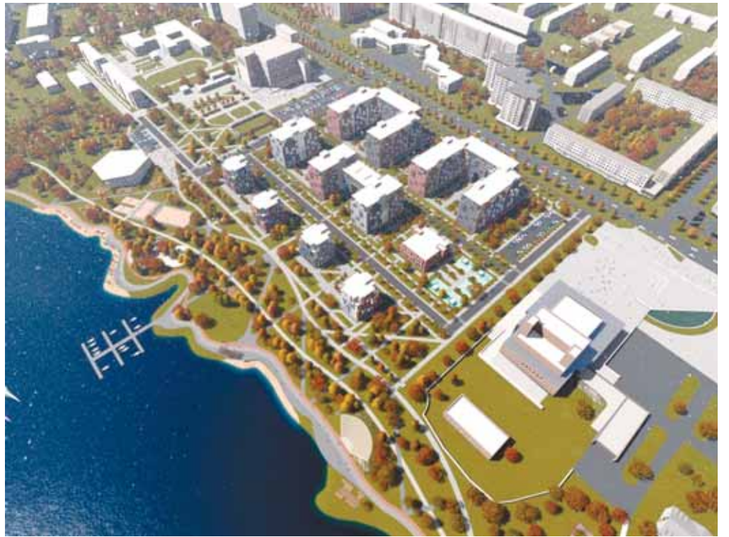
Жилой комплекс будет состоять из восьми домов, для каждого из которых предусмотрен большой подземный паркинг и наземная гостевая парковка. Дворовая территория останется свободной от машин, общедоступной для горожан, как и парк у озера.

К 2020 году планируется с учетом пожеланий городских властей и жителей Северодвинска доработать концепцию наилучшего использования территории, выполнить инженерные изыскания, разработать и утвердить документацию по планировке, а также детальные проекты рекреационной зоны, социальных объектов и зоны жилой застройки.