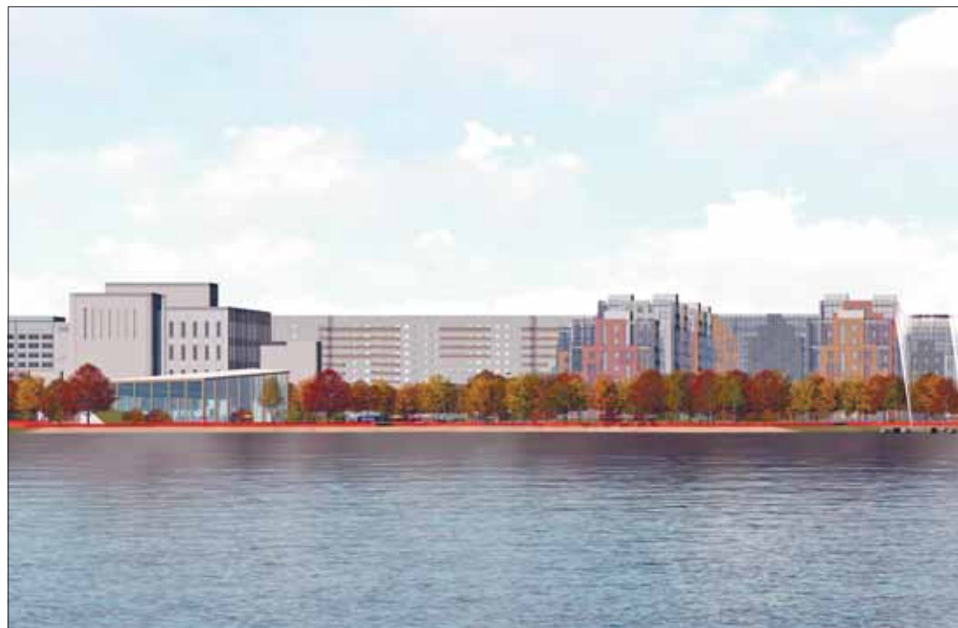
По действующему в Северодвинске нормативу коэффициент застройки территории, примерно 1,8 га. Остальная территория отводится под благоустройство: у каждого дома

– Это первый подобный инвестиционный проект в нашем регионе, очень ответственный и важный для города. Объем инвестиций – более 2 млрд рублей. В результате реализации проекта Северодвинск получит новое современное жилье в качественном архитектурном исполнении, детский сад на 280 мест и парковую рекреационную зону для отдыха горожан.