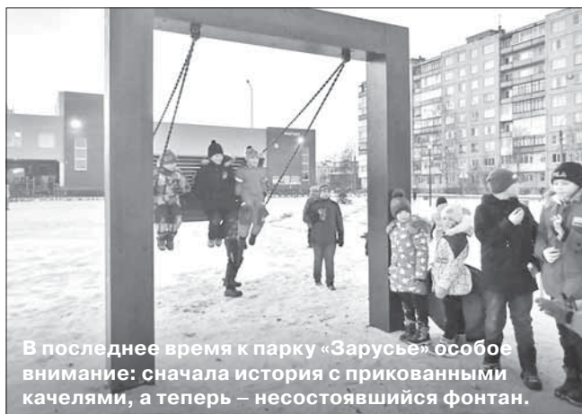
В последнее время к парку «Зарусье» особое внимание: сначала история с прикованными качелями, а теперь – несостоявшийся фонтан.

Остановимся на характеристиках бюджета следующего года. Объем доходов спрогнозирован на уровне 10 млрд 535 млн рублей. При этом расходы составят более 10,7 млрд рублей. Плановый дефицит городского бюджета – 246 млн рублей. Это примерно 5% от общего годового объема доходов муниципалитета без учета безвозмездных поступлений.