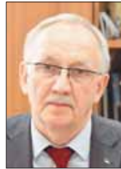
Сергей ЭМАНУИЛОВ, председатель комитета по социальной политике, здравоохранению и спорту Архангельского областного Собрания (фракция «Единая Россия»):