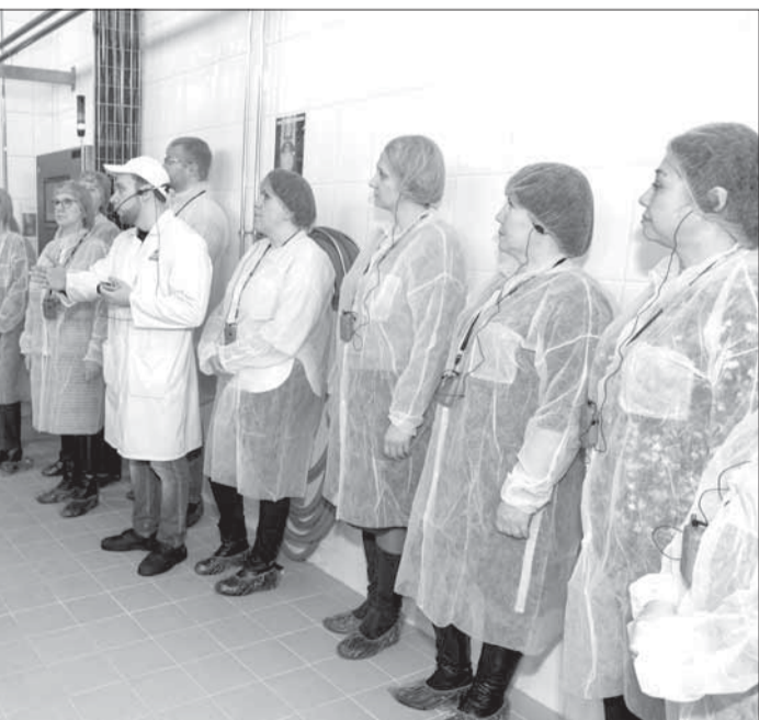
В рамках семинара для специалистов молочной отрасли были организованы посещение производства и дегустация продукции Архангельского молочного завода.

Иконы находятся в музее на временном хранении. Восстанавливают раритеты в основном приезжие мастера из Москвы и Санкт-Петербурга.