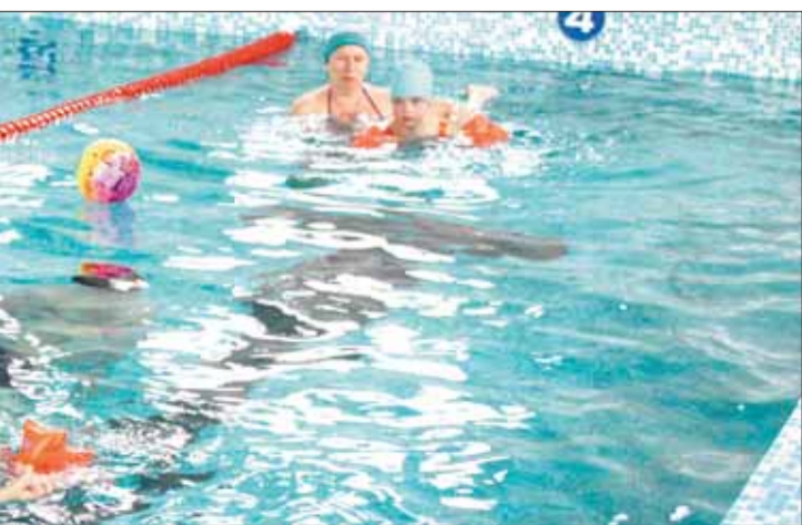
...щиеся без попечительства родителей, дети с ... в бассейне проходят необходимую реабилитацию.

...водство комбината, акционеры откликаются ...ци в реализации самых разных проектов ...ализации наших воспитанников. К слову, ...льского ЦБК – частые гости учреждения, всегда ...то происходит у нас, как растут и развиваются ...торые проекты интерната благодаря помощи ...региональными: более пяти лет комбинат ...нии областного фестиваля-конкурса ...«А!»), который проходит на базе учреждения. ...вой помощи градообразующего предприятия ...ется в яркое шоу с подарками, красочными ...онечно, улыбками детей.