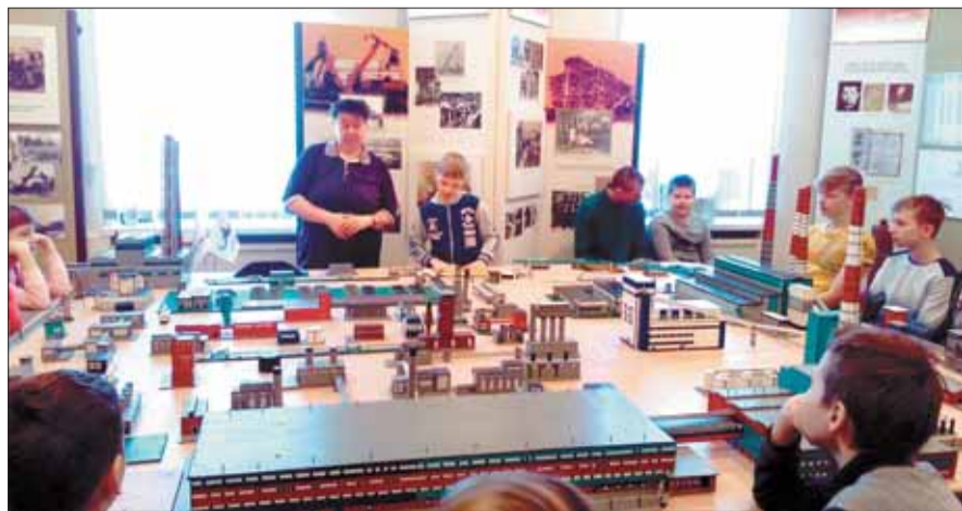
Воспитанники Новодвинского детского дома на экскурсии в музее АЦБК познакомились с интересными фактами и событиями из истории строительства комбината, с этапами создания бумаги: от щепы до готовой продукции.

– Всегда руко на просьбы о помо для активной социа сотрудники Арханг интересуются тем, ч воспитанники. Неко АЦБК и вовсе стали помогает в проведе танца «Живи, танцу». Благодаря финансо праздник превраща выступлениями и, к