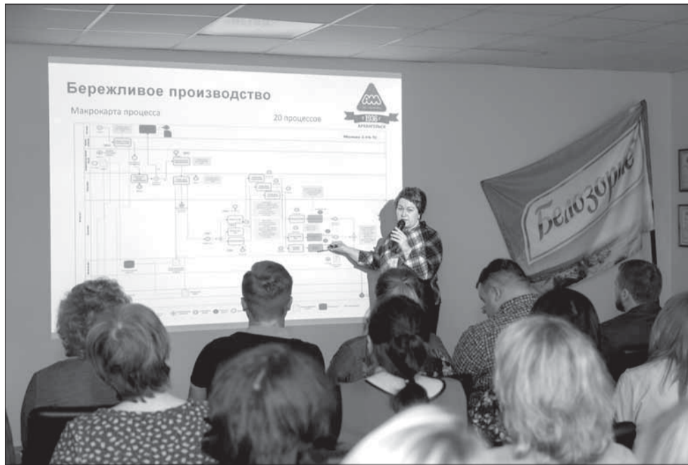
На Архангельском молочном заводе участникам всероссийского информационного семинара «Молинформ» представили концепцию Бережливого производства.

Концепция Бережливого производства основана на постоянном стремлении устранять все виды потерь (не путать с расходами), которые снижают эффективность работы на любом этапе производственного цикла, и предполагает вовлечение в процесс оптимизации бизнеса каждого сотрудника, максимальную ориентацию на потребителя. На старте проекта завод при-