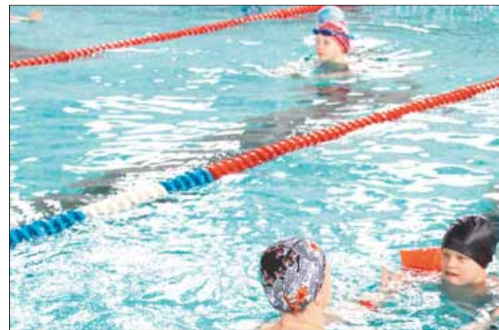
Благодаря ежемесячной помощи комбината, дети, оставшиеся особенностями физического развития могут на занятиях