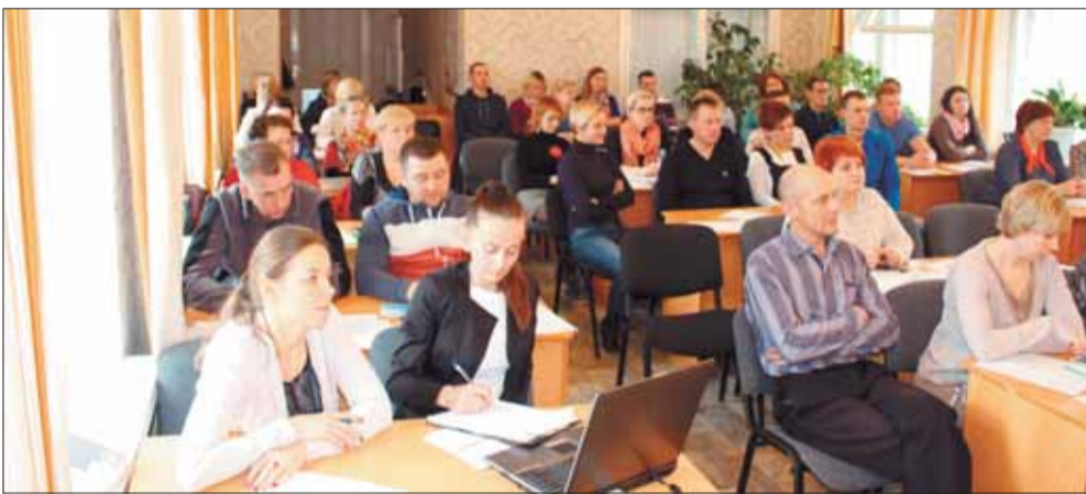
13 февраля МКК «Развитие» принял участие в семинаре – в Устьянском районе, результат – несколько заявок на займы от местных предпринимателей.

МКК АРХАНГЕЛЬСКИЙ РЕГИОНАЛЬНЫЙ ФОНД «РАЗВИТИЕ» г. Архангельск, ул. Урицкого, 49, корп. 3, стр. 1 Тел.: (8182) 63-95-47 e-mail: expert@cmf29.ru www.cmf29.ru