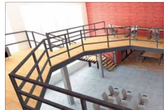
Уже через 2-3 месяца в коворкинге ждут креативных предпринимателей.