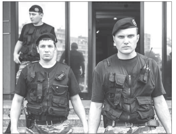
Социальные учреждения должны соответствовать стандартам антитеррористической защищенности: охранять их может только ЧОП, имеющий специальное разрешение.