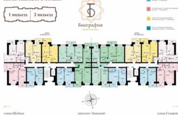
ПЛАН ТИПОВОГО ЭТАЖА

также декоративное освещение. Отдельная рампа въезда в гараж со стороны двора спроектирована как multifunctional art-object: зимой она может использоваться как горка с лестницей, летом – как беседка. Со стороны