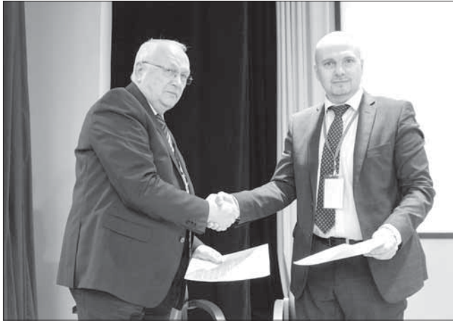
Подписание соглашения о партнерстве между Судостроительным кластером Архангельской области и пермским кластером «Фотоника»

18–19 октября в Архангельске состоялся шестой международный форум «Арктические проекты – сегодня и завтра». Главный вывод, который можно сделать по итогам мероприятия, – наш регион стал одним из ключевых участников промышленного и инфраструктурного строительства в Арктической зоне.