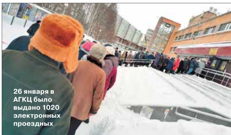
26 января в АГКЦ было выдано 1020 электронных проездных