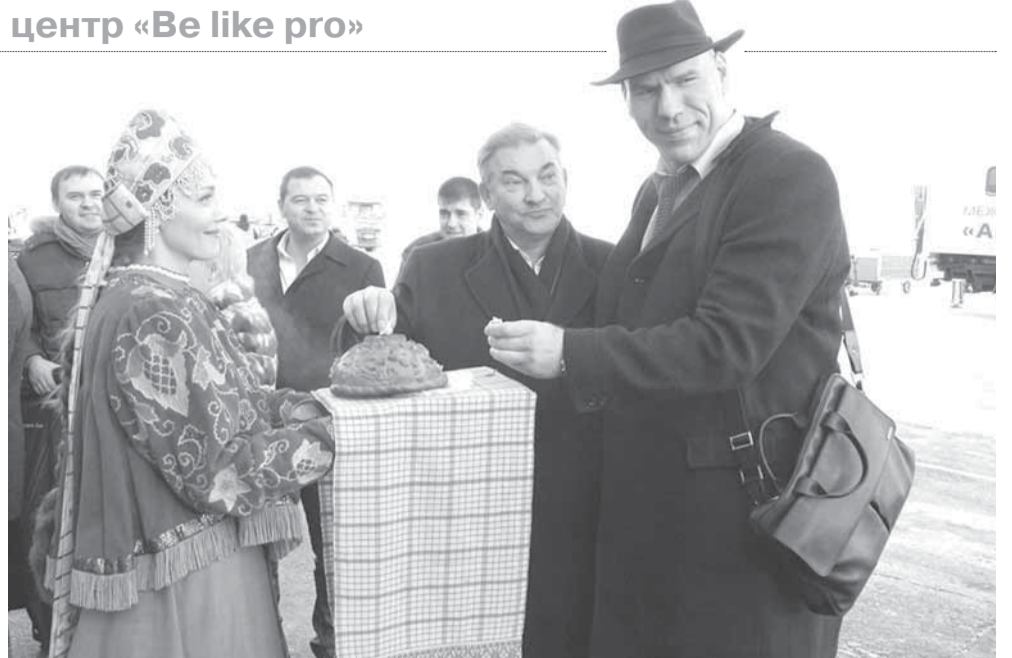
«Большие» гости перед открытием центра «Be like pro» в Архангельске, ставшем первым после Москвы городом, где появился хоккейный центр такого уровня.

Еще раньше начал судебное разбирательство фонд «Устойчивое развитие Поморья» – когда последние переговоры с должниками, состоявшиеся в октябре, не дали результатов. Инвестор потребовал вернуть долг с набегавшими процентами, а также сам хоккейный центр. Председатель областной федерации хоккея и управляющий «Be like pro» предложили несколько альтернатив такому кардинальному решению. По их мнению, чтобы сохранить социальный характер проекта, который вначале поддерживали все партнеры, целесообразнее было бы передать