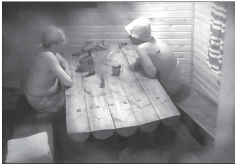
Кадр из видеозаписи, размещенной на сайте www.youtube.com