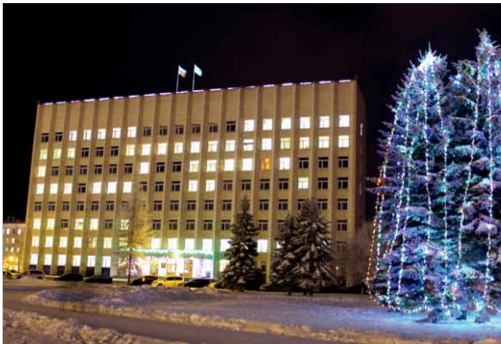
ФОТО АРХАНГЕЛЬСКОЙ ОБЛАСТИ

Предновогодние дни – время подведения итогов работы и планов на будущее. Именно этим сейчас, в период подготовки к завершающей декабрьской сессии и принятию бюджета региона, заняты все комитеты Архангельского областного Собрания. Оперативным отчетам посвящена и большая часть четвертого номера «Парламентского вестника».