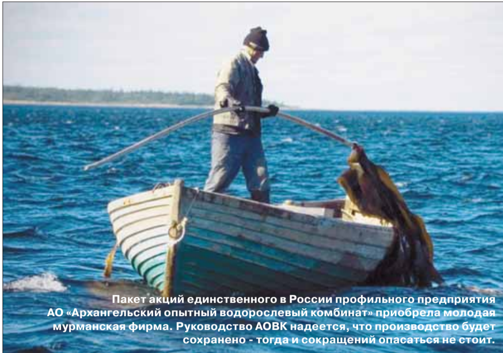
Пакет акций единственного в России профильного предприятия АО «Архангельский опытный водорослевый комбинат» приобрела молодая мурманская фирма. Руководство АО ВК надеется, что производство будет сохранено - тогда и сокращений опасаться не стоит.

Вопреки ожиданиям, покупателем активов АО «АРХАНГЕЛЬСК-ГЕОЛДОБЫЧА», ведущим разработку алмазного месторождения им. В. Гриба, стала не АК «АЛРОСА»: сделка на 1,45 млн долларов заключена с частной финансовой группой «Открытие Холдинг».