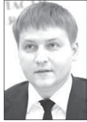
Семён ВУЙМЕНКОВ, министр экономического развития Архангельской области:

– Правительством Архангельской области была инициирована большая работа, направленная на компенсацию дополнительной нагрузки по «северным» льготам. В Российской Федерации на законодательном уровне предусмотрено предоставление пониженных ставок страховых взносов для отдельных категорий предпринимателей. Сейчас льготы получают представители бизнес-сообществ, осуществляющих деятельность на территориях опережающего социально-экономического развития. Мы предлагаем применить соответствующие компенсационные меры на территории субъектов, входящих в Арктическую зону РФ.