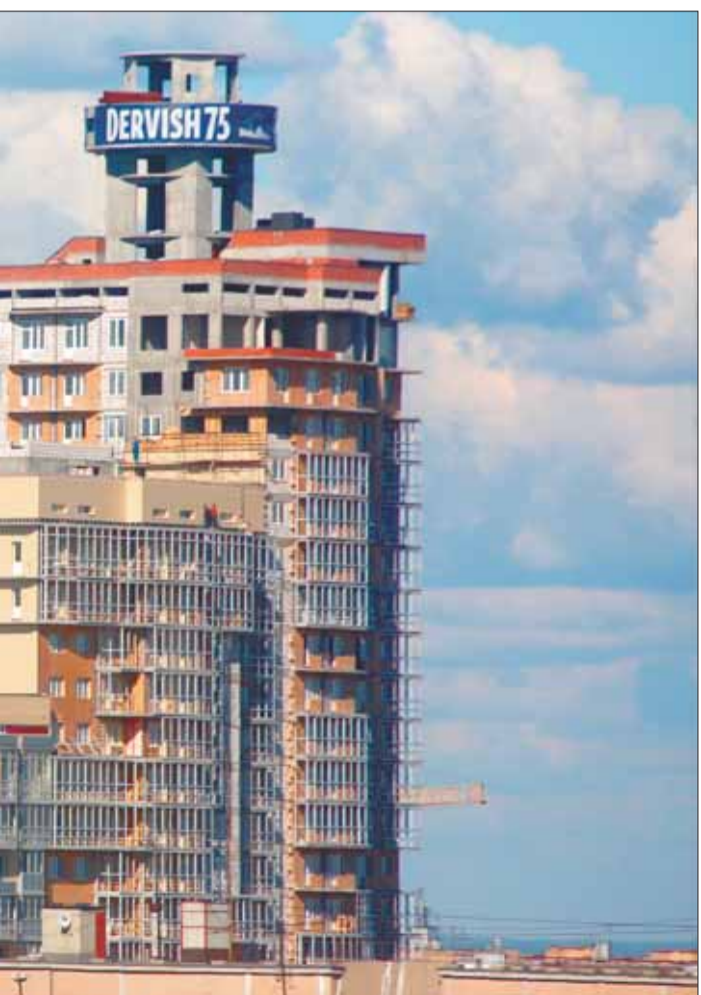
второй очереди 19-25-этажного комплекса было забито фундаменте можно возводить здания в 50 этажей.