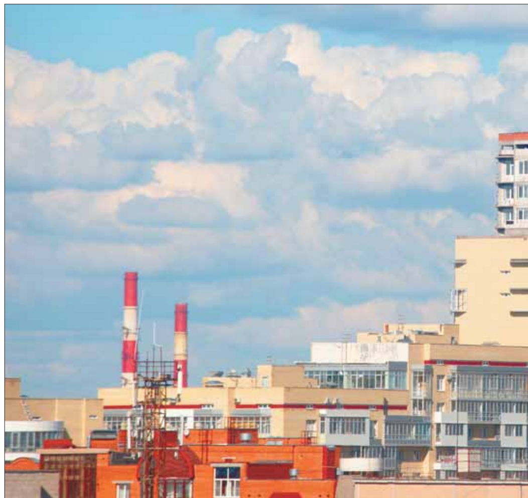
25-этажный ЖК «Империал» стал первой жилой высоткой в Поморье. При возведении порядка 1500 свай, несущая способность каждой из которых 90 тысяч тонн. На таком