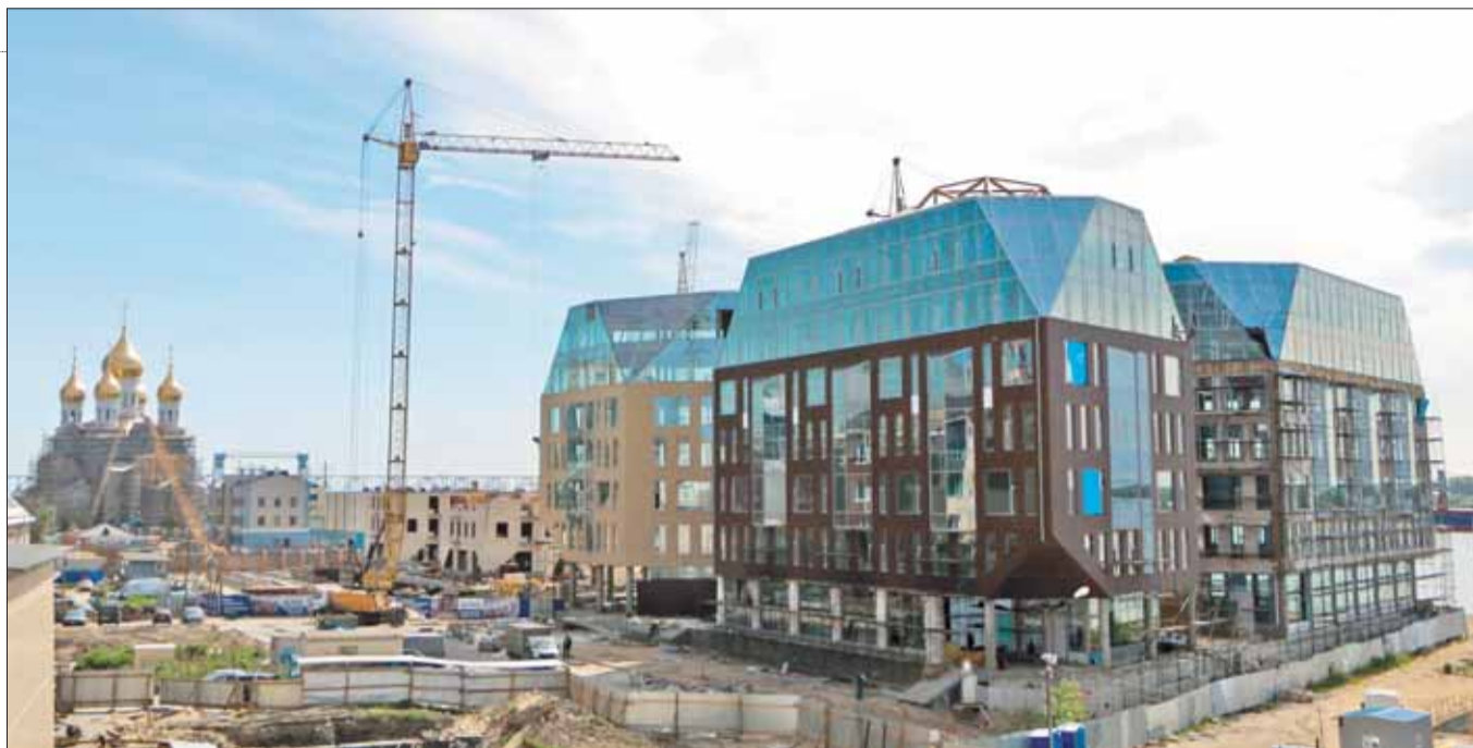
Бизнес-центр класса «А» DELTA на набережной Северной Двины окружен водой с трех сторон. Здание спроектировано таким образом, что из большинства окон открывается потрясающий вид на реку.

Инвестиции в недвижимость в Архангельске всегда были привлекательной нишей для предпринимателей. Всего в строящихся объ-