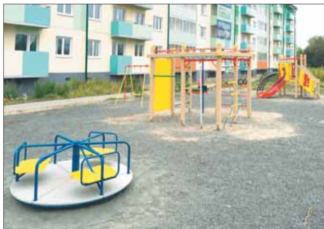
Продуманные зоны отдыха, детские площадки и благоустроенные дворы домов холдинга «Аквилон-Инвест» оценили тысячи семей Поморья.

– Строительная индустрия – это хребет любой экономики, это занятость, двигатель развития региона. Потребность людей в улучшении жилищных условий остается по-прежнему высокой, и удовлетворить этот спрос можно только с использованием надежных рыночных механизмов. «Аквилон-Инвест» как социально ответственная компания поддерживает курс городских властей на упорядочивание вопросов застройки города, выработку единых требований и правил. Мы готовы к участию в реализации проектов комплексного освоения территорий, в том числе и в рамках государственно-частного партнерства.