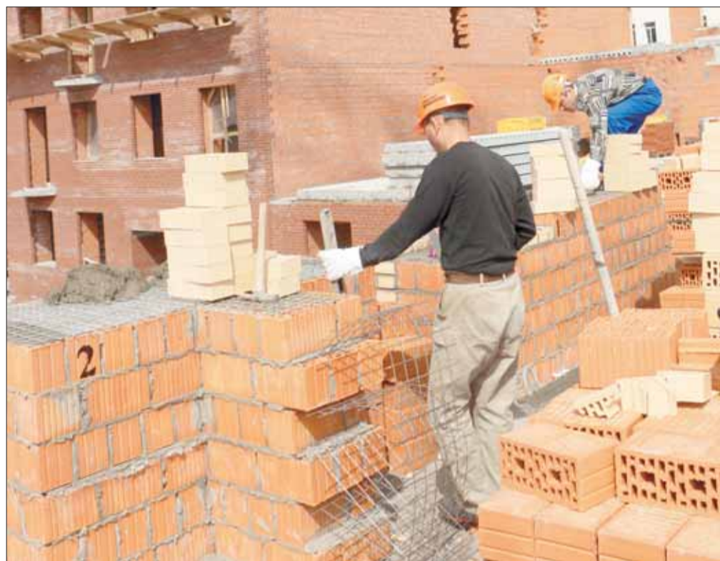
«Аквилон-Инвест» стал одним из первых, кто применил «Теплую керамику» в условиях Европейского Севера как стратегический материал для домостроения, отказавшись от традиционных панелей и силикатных кирпичей.

Если целиком новую набережную горожане и гости столицы Поморья увидят в 2018 году, то сдача в эксплуатацию самого высокого жилого здания в Архангельске – ЖК «Империал» – запланирована на декабрь 2017 года. Дом на 300 квартир строится с большим запасом прочности: было забито поряд-