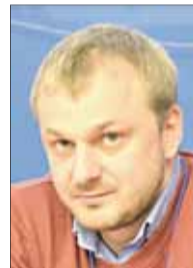
Иван НЕЧАЕВ, вице-президент фонда Access Industries:

– В Фонд «Сколково» приходят стартапы, основное требование к которым – инновационный продукт и обязательное понимание его востребованности на рынке. Сейчас из 1168 стартапов гранты получили 260 компаний, общая сумма инвестиций 14 млрд рублей, и на 16 млрд привлечено средств частных инвесторов. Мы являемся инструментом, который разбавляет риск частного инвестора. Инвестиционно привлекательный бизнес для нас – это инновационные решения по пяти направлениям: космос и телекоммуникации, ядерные и промышленные технологии, информационные технологии, биотехнологии, энергоэффективные технологии. Про каждому направлению есть своя группа экспертов, которая оценивает инновационную составляющую проекта и его коммерческую применимость.