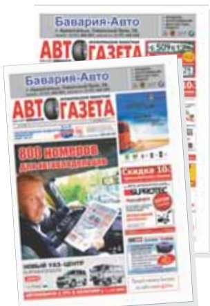
ООО «Индик-Экспресс», Реклама.

20 лет автомобилисты Архангельской области начинают рабочую неделю с еженедельника «АВТОгазета»