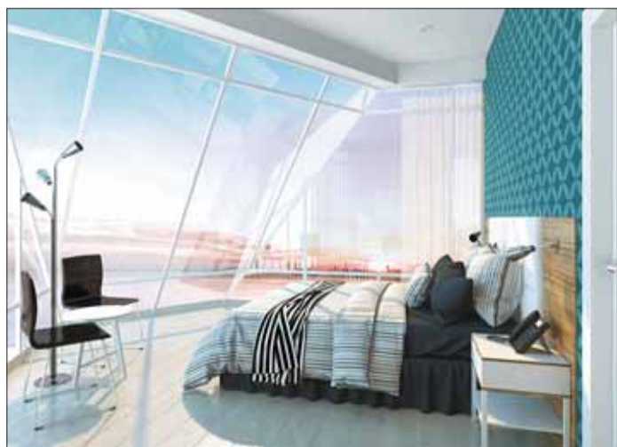
Для вашего удобства во всех апартментах есть Wi-Fi и телевизор с доступом к российским и международным каналам, телефон, система «Умный дом», круглосуточная охрана и видеонаблюдение.

Стать обладателем недвижимости в DELTA Apartments просто и выгодно. Надежный застройщик, холдинг «Аквилон-инвест», предлагает рассрочку под ноль процентов до окончания строительства равными ежемесячными платежами при первом взносе от 10%. Старт продаж дан 15 октября, первые десять будущих жильцов DELTA Apartments получат дополнительную скидку 10% от девелопера. Предварительные заявки на приобретение апартментов DELTA Apartments принимаются по телефону (8182) 65-00-08.