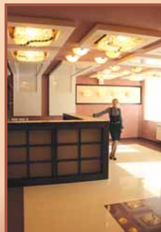
Реклама, ООО «Новый век».