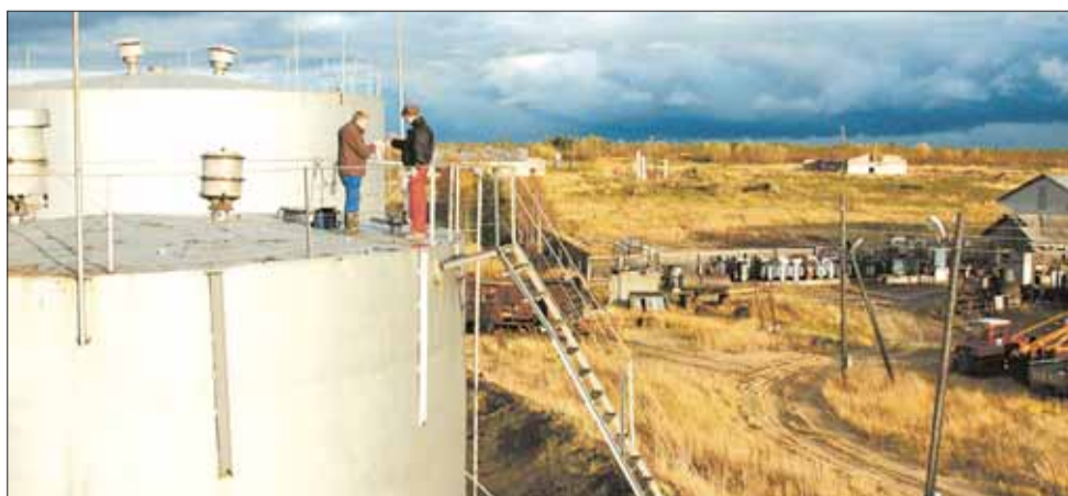
Ежегодно на Мезенскую ДЭС завозится 3700 тонн дизельного топлива.

В рамках реализации экологической политики ежеквартально производится аналитический контроль выбросов загрязняющих веществ в атмосферу от деятельности Мезенской ДЭС. Мезенская дизельная электростанция – единственный объект генерации, находящийся на балансе «Архэнерго», и предмет особого внимания электросетевой компании. Ежегодно филиал обеспечивает поставку почти 3700 тонн дизельного топлива для бесперебойного электроснабжения Мезенского района. Для снижения экологического ущерба закупается топливо высокого качества, которое соответствует европейским стандартам. В его составе снижено содержание серы, что уменьшает выброс в атмосферу вредных веществ. Пригодность топлива подтверждается экспертизой независимой специализированной испытательной лаборатории.