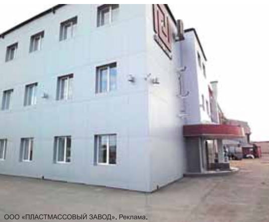
ООО «ПЛАСТМАССОВЫЙ ЗАВОД», Реклама.

г. Архангельск, ул. Стрелковая, 19 тел. +7-925-386-01-45