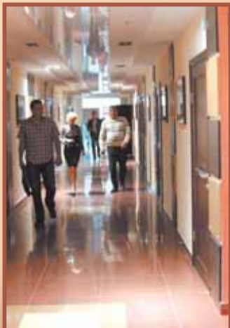
Реклама ООО "Новый век"