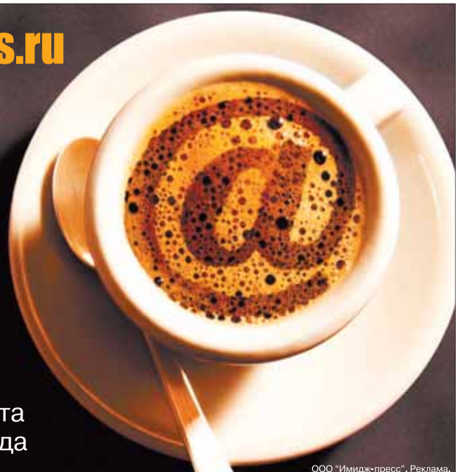
ООО «Имидж-пресс». Реклама.

25 500 – уникальных посетителей сайта в апреле 2014 года