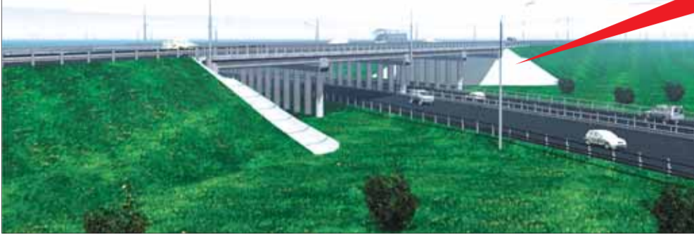
Развязка Северодвинск – Архангельск