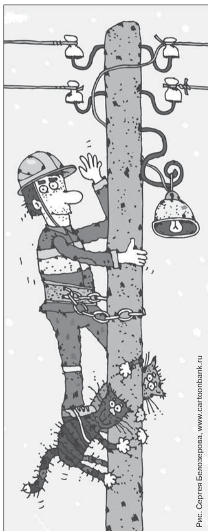
Рис. Сепрен Белоэпова, www.cartoonbank.ru

Заявитель подписывает оба экземпляра проекта договора в течение 30 дней с даты получения подписанного сетевой организацией проекта договора и направляет в указанный срок один экземпляр сетевой организации с приложением к нему документов, подтверждающих полномочия лица, подписавшего такой договор.