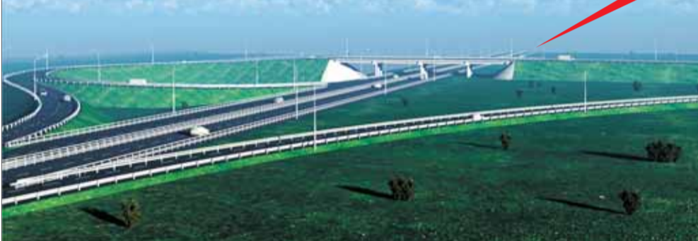
Краснофлотская развязка (вид со стороны Москвы)

На федеральной трассе М8 от поселка Дорожников до развязки на Северодвинск завершаются земляные работы. До конца 2014 года строители намерены возвести все искусственные сооружения и приступить к асфальтированию трассы. Полноценная четырехполосная дорога, по планам, будет открыта осенью 2015 года. Масштабная реконструкция трассы Архангельск – Северодвинск начнется в 2017 году. Пока здесь идут только ремонтные работы.