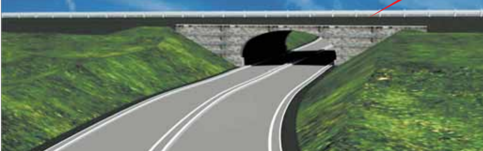
Развязка на Васьково (вид со стороны поселка)