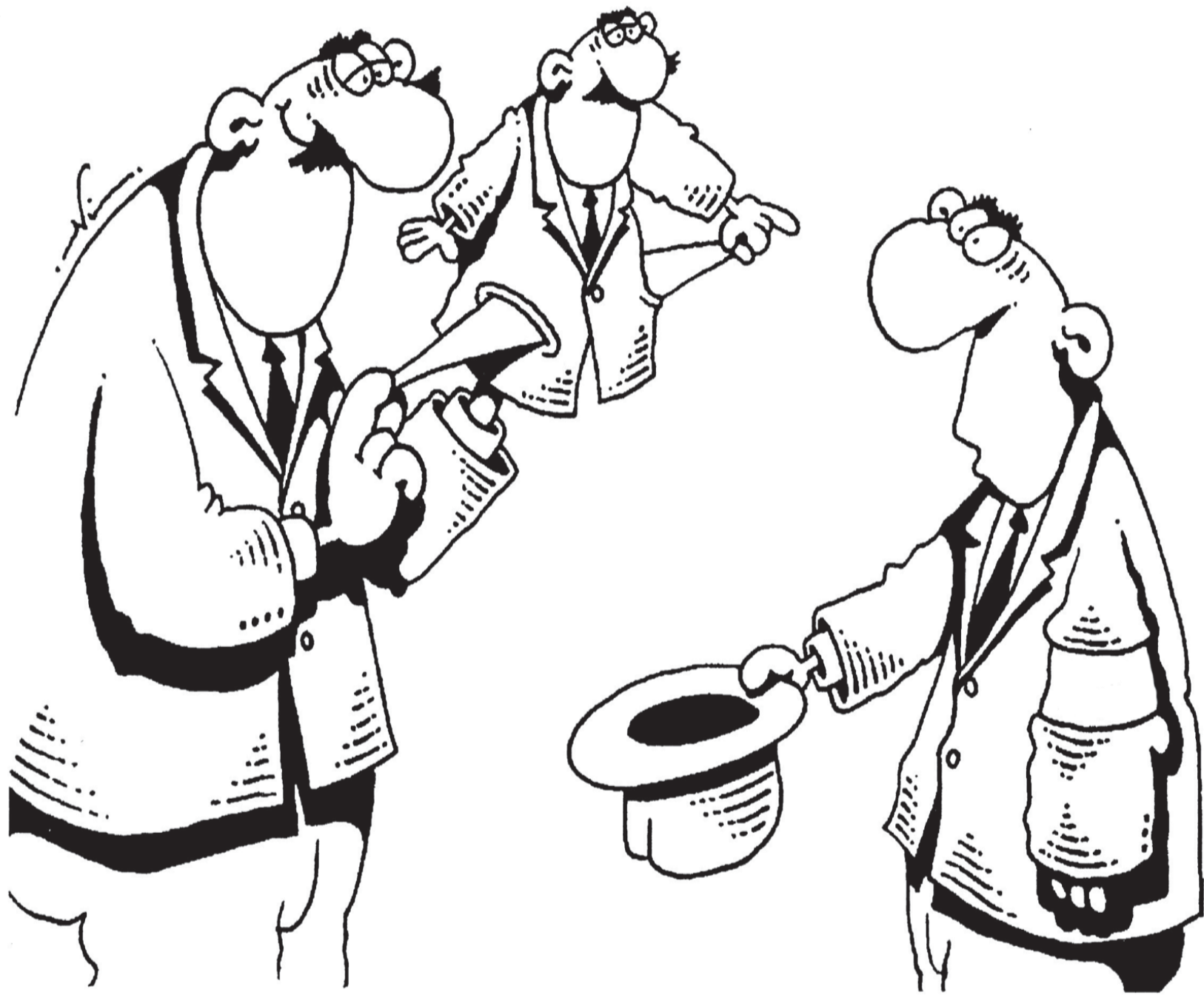
Рис. Игоря Кийко, www.carttoonbank.ru