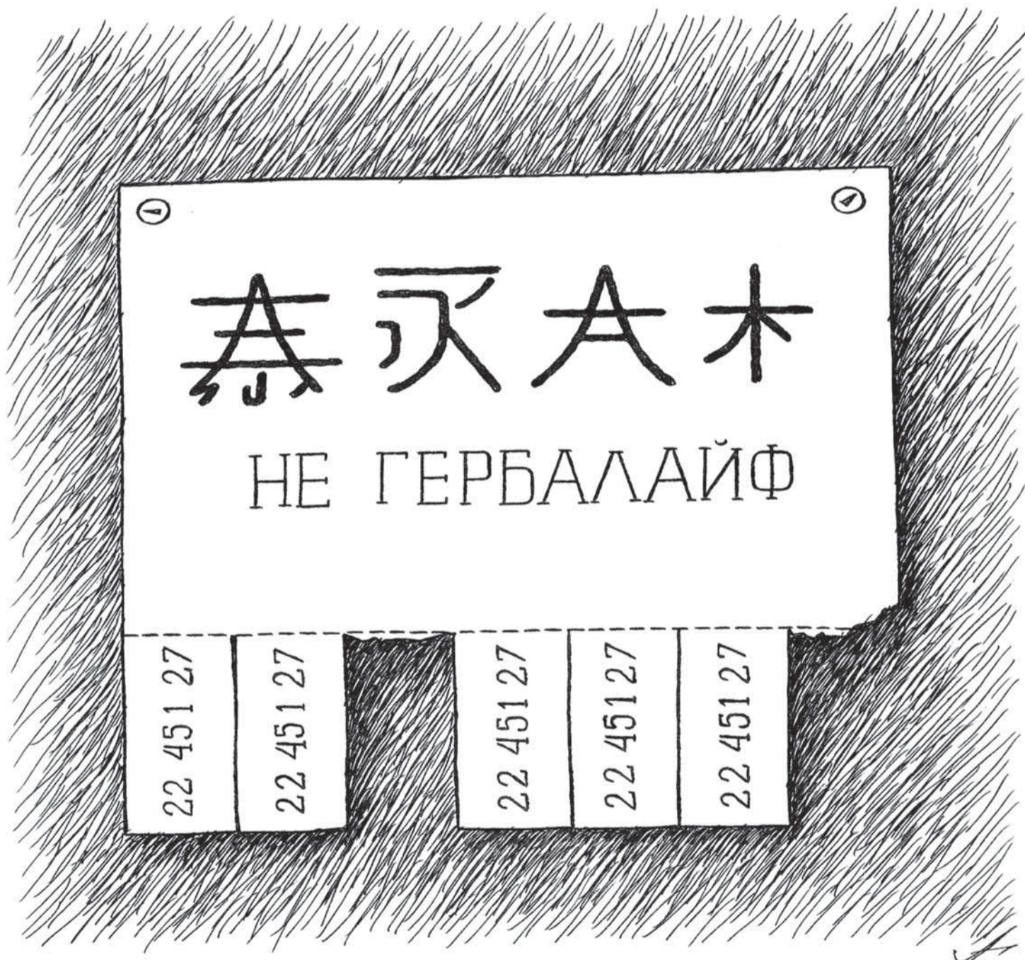
Рис. Аркадия Гурского, www.cartoonbank.ru

Государство в попытке ограничить рекламу народных целителей и «лечебных» БАДов перегнуло палку: с 1 января медицинским клиникам запрещено рекламировать свои услуги. Такому жесткому подходу удивлена даже ФАС.