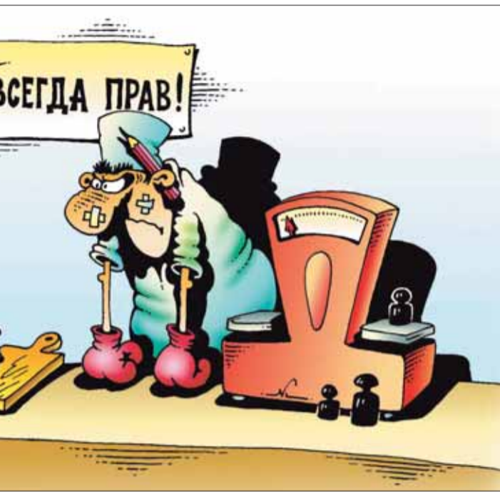
Рис. Игорь Кийко, cartoonbank.ru

Мое утверждение проверено на практике, а выразить его можно очень простой фразой: говорите с собеседником на его языке. Это не значит, что нужно использовать примитивную лексику. Покупатели разные, и - уверяю - среди них найдутся те, для кого недостаточно грамотной и красивой речи, им подавай сленг профессионального уровня.