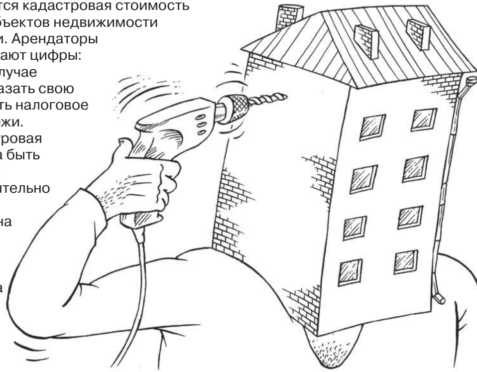
Рис. Максима Смагина. www.cartoonbank.ru

В несколько раз снижается кадастровая стоимость земельных участков и объектов недвижимости в Архангельской области. Арендаторы и собственники оспаривают цифры: практически в каждом случае заявителям удается доказать свою правоту, а значит, снизить налоговое бремя и арендные платежи. Как оказывается, кадастровая стоимость хоть и должна быть приближена к рыночной, на практике может значительно ее превышать. Но пока бюрократическая машина поедает время и деньги налогоплательщиков, государство остается в выигрыше: переоценка позволила повысить доходы бюджетов — как за счет налогов и аренды, так и за счет госпошлины в судах.