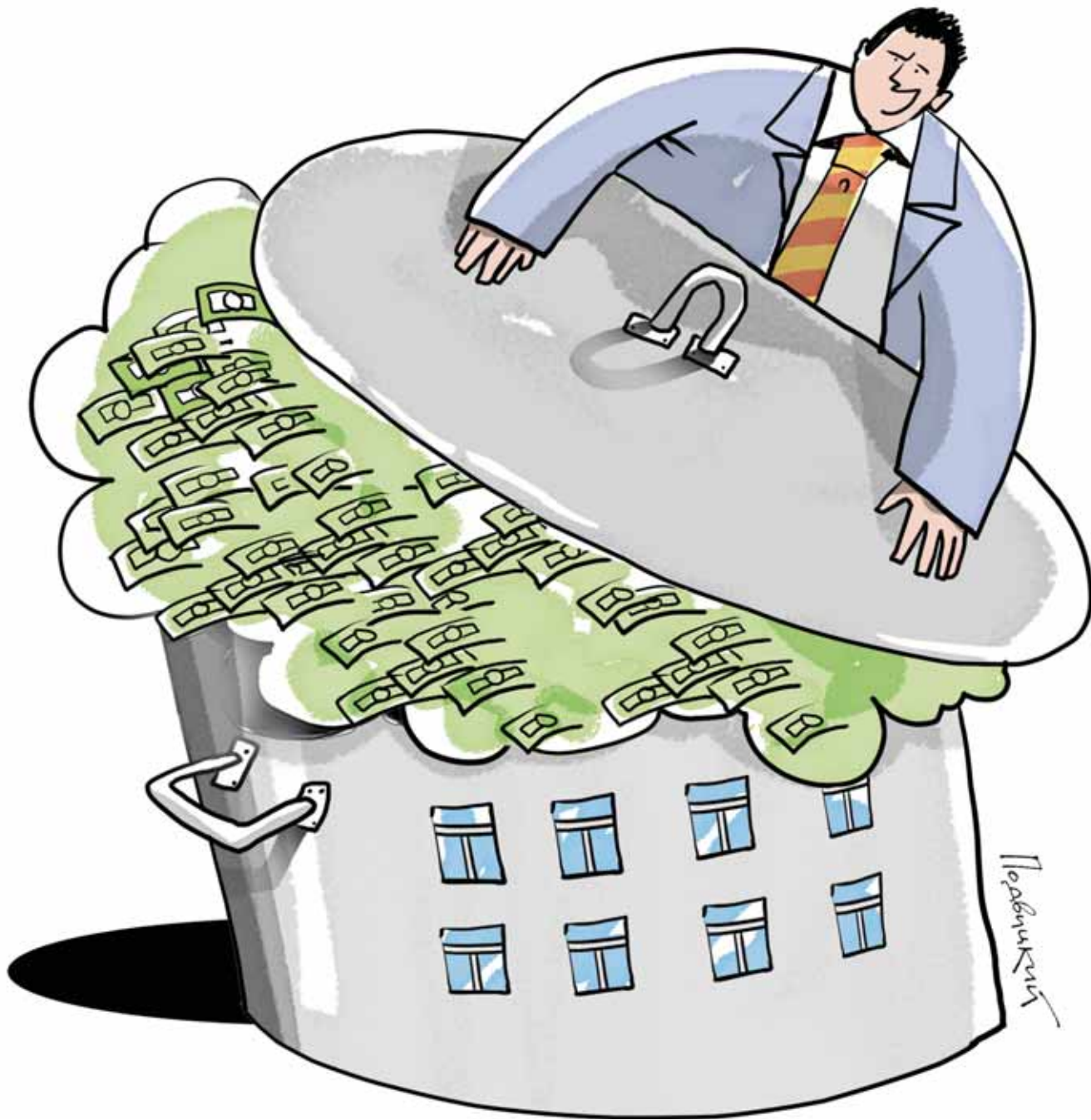
Рис. Виталия Подвицкого. www.cartoonbank.ru

Судьи трактуют подобные иски как «преобразовательные», то есть новые цифры начинают действовать с момента вступления в силу решения суда. Другими словами – если переплачивал год или два, обратно деньги не вернутся.