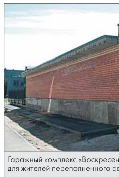
Гаражный комплекс «Воскресен» для жителей переполненного св...

Многоуровневый гаражный комплекс «Юпитер» на ул. Карла Либкнехта оснащен современными системами охраны, безопасности, вентиляции и пожаротушения. На первом этаже откроются сервисные центры (в том числе автомойка и шиномонтаж), предусмотрен пассажирский лифт до пятого этажа.