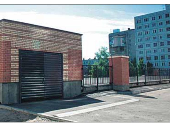
ская, 116/3» – отличное решение для владельцев автомобилей Привокзального микрорайона