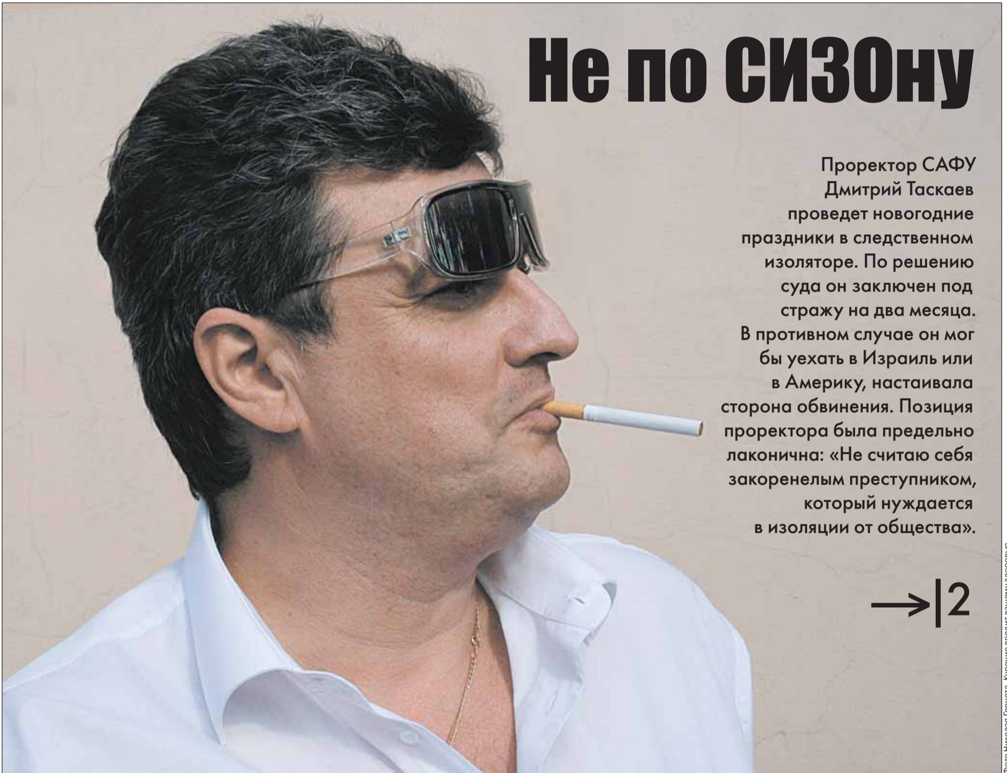
Курение вредит вашему здоровью.