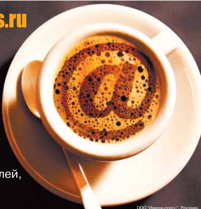
ООО «Имидж-пресс». Реклама.

Аудитория сайта 19 тыс. посетителей, 44 тыс. ВИЗИТОВ (ежемесячно)