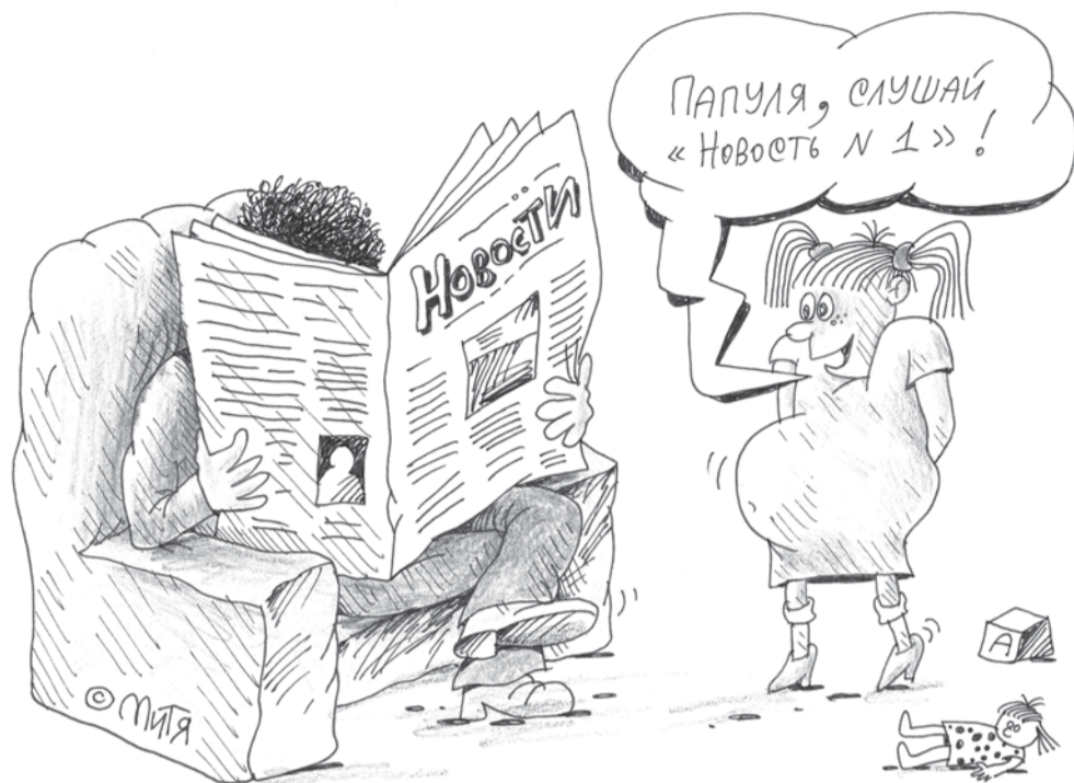
Рис. Дмитрий Кононов, www.cartoonbank.ru

достигнутом Госдума не собирается. Депутата беспокоит засилье брани в мировой паутине.