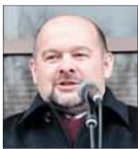
Игорь ОРЛОВ, губернатор Архангельской области:

– Газпромбанк – новое имя на территории Архангельской области. Банк имеет статус и соответствующие ресурсы, которые так необходимы для развития нашего региона. Мы провели большую плодотворную работу, которая касалась не открытия кабинетов, а создания условий для инвестирования в область и раскрытия потенциала банка. Как глава региона я рад, что у нас появился такой надежный партнер.