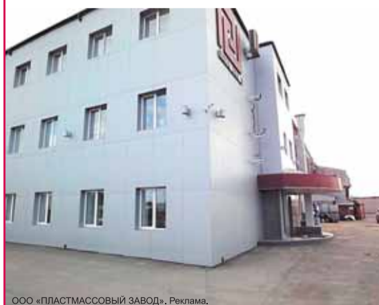
ООО «ПЛАСТМАССОВЫЙ ЗАВОД», Реклама.

г. Архангельск, ул. Стрелковая, 19 тел. +7-925-386-01-45