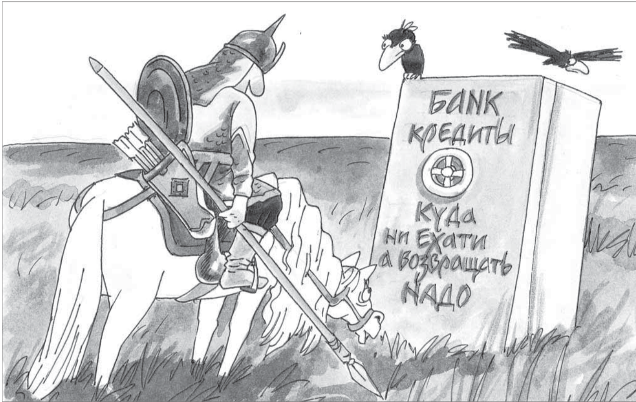
Рис. Валентина Дружинина, cartoonbank.ru