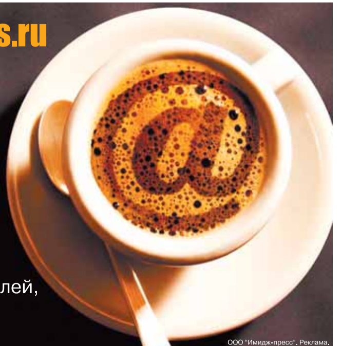
ООО «Имидж-пресс». Реклама.

Аудитория сайта 19 тыс. посетителей, 44 тыс. визитов (ежемесячно)