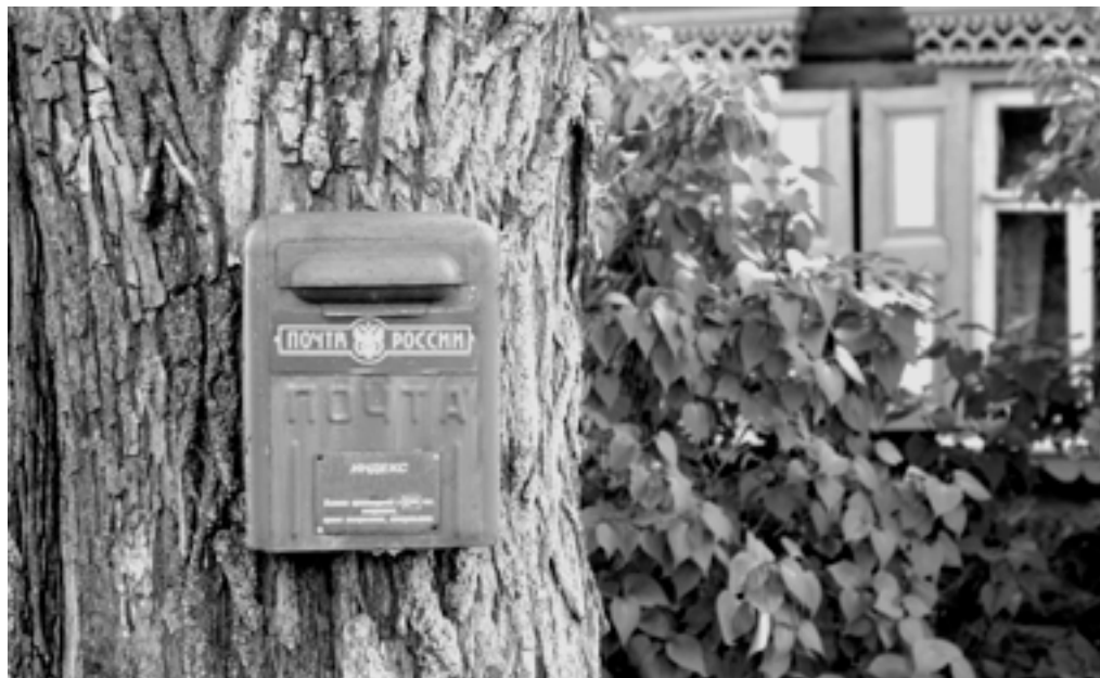
Первые шаги нового менеджмента на пути реформирования уже обозначены: нужно сохранить все отделения связи и повысить зарплаты рядовым работникам.

Структура доходов ОПС выглядит так: 30% — выплаты пенсий и пособий, 18% — пересылка письменной корреспонденции, 15% — торговля, 14% — коммунальные платежи, 7% — денежные перево-