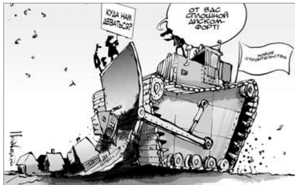
Рис. Виталия Подвицкого, www.cartoonbank.ru

Именно такой будет начальная цена выкупа земельных наделов, мешающих реконструкции трассы М-8 на участке Архангельск - Северодвинск. Сносу подлежит два десятка частных усадеб в деревне Малое Тойнокурье и поселке Цигломень общей площадью почти 16 га. Владельцы хоть и не желают расставаться с обустроенными за много лет земельными участками, но с федеральной властью больше не спорят. По закону все четко: не отдашь сам - выкупят по суду.