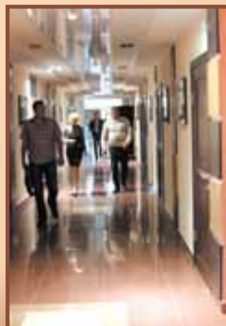
Реклама ООО «Новый век».