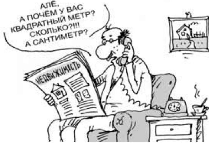
Рис. Сергей Кокорев, www.cartoonbank.ru

Цены на рынке недвижимости в Архангельске снизились. Риэлторы отмечают: хотелось бы, чтобы падение на перегретом рынке было больше, но пока приходится радоваться тому, что есть. В среднем по городу цены предложения упали на 1,5%, но это с учетом того, что в первом квартале рынок топтался на месте. Фактически основное снижение пришлось на второй квартал. Но стоимость отдельных, особо завышенных категорий квартир снизилась на 5-6%. А вот цены на новостройки за полгода поднялись в пределах 3-5%.