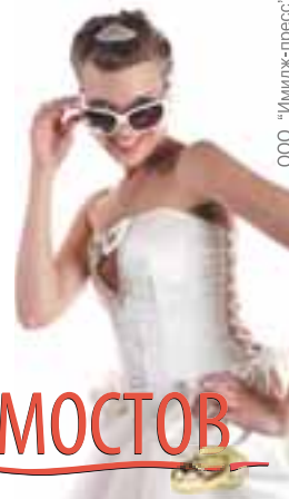
ООО «Имидж-пресс». Реклама.