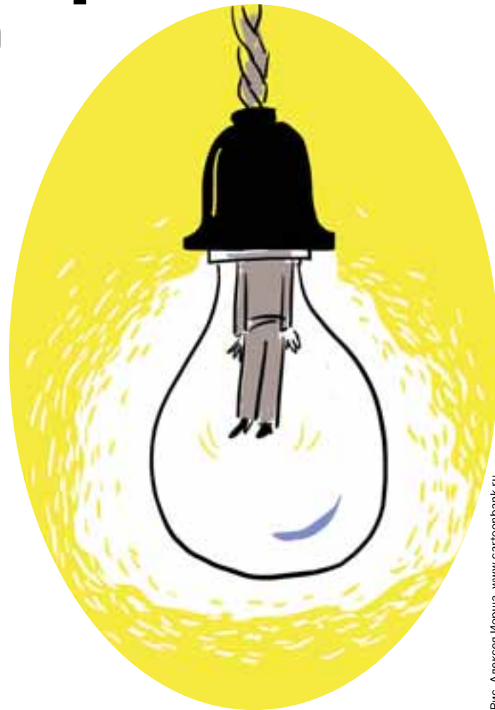
Рис. Алексей Иорша, www.cartoonbank.ru

Официальные комментарии по теме долгов компании пресс-секретарь Архэнергосбыта давать отказался. Однако по общей риторике публикаций в СМИ позиция ясна. «Сбытовой сектор энергоотрасли не слишком устойчив и подвержен зна-