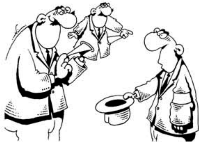
Рис. Игоря Кийко. www.cartoonbank.ru

Госдума приняла закон о снижении для индивидуальных предпринимателей выплат во внебюджетные фонды. Для тех, у кого годовой доход не превышает 300 тысяч рублей, все вернется на «круги своя»: исходя из действующего МРОТ платить придется около 19 тысяч рублей против нынешних 35 тысяч. А вот для более успешной части предпринимателей с доходом выше 300 тысяч отчисления могут серьезно подрасти: для них по сути установлен дополнительный налог с оборота.