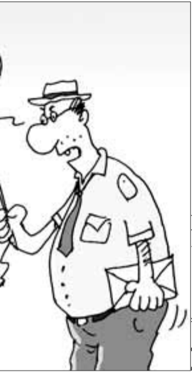
Рис. Сергей Кокорев. www.cartoonbank.ru