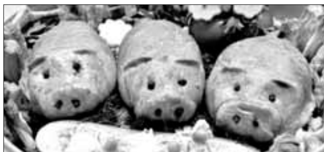
ООО «ИМИДЖ-ПРЕСС». Реклама.

14.30-15.00 Поморский пир на Чумбаровке «Где блины, тут и мы!». Угощение блинами. (пр. Чумбарова-Лучинского и ул. И. Кронштадтского)