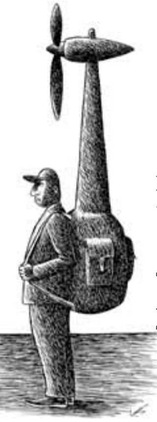
Рис. Аркадия Гурского www.cartoonbank.ru

До 2020 года запланировано строительство 17 новых биотопливных котельных и теплоэлектростанций, а в планах на реконст-