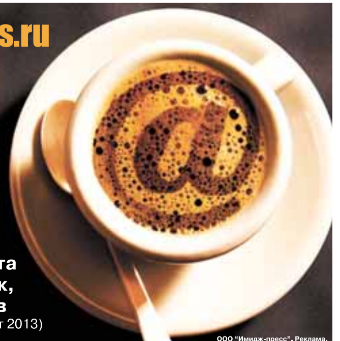
ООО «Имидж-пресс». Реклама.

Аудитория сайта 23 тыс. человек, 55 тыс. ВИЗИТОВ (счетчик mail.ru за март 2013)