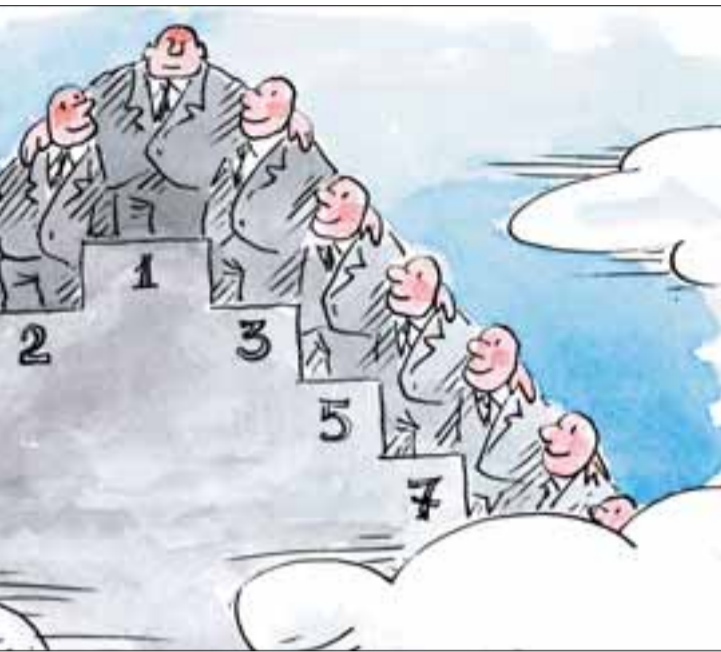
Рис. Бориса Эрнста. www.gartoonbank.ru