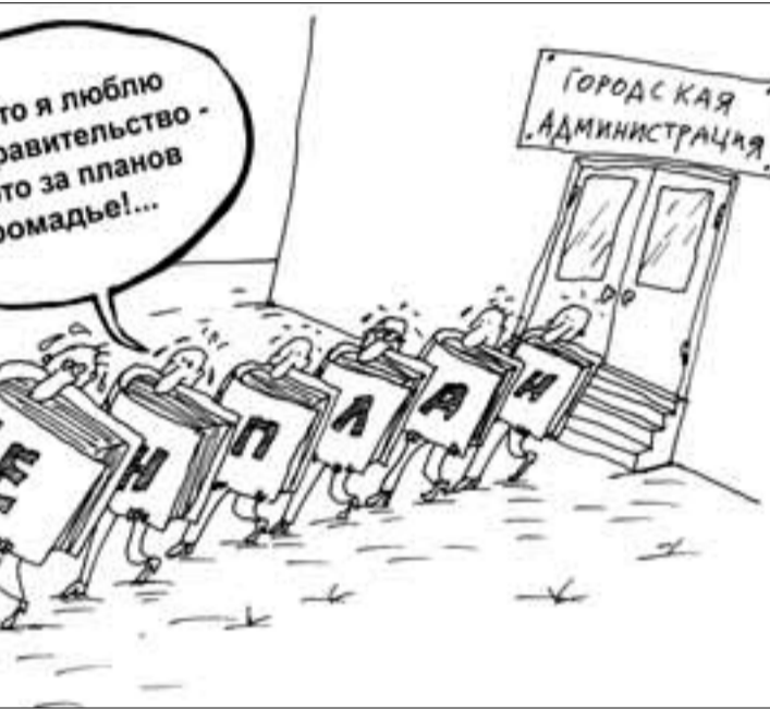
Рисунок Вячеслава Шилова www.cartoonbank.ru

должны чувствовать их перспективы и контролировать реализацию».