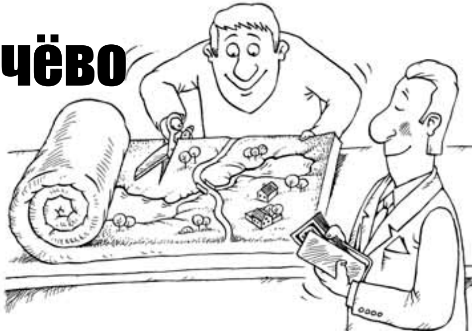
Рисунок Максима Смагина. www.sagtoobank.ru

Еще есть шансы предотвратить гибель стабильно работающего предприятия и спасти от голода 300 семей. ОАО «Молоко», заинтересованное в продукции племза-