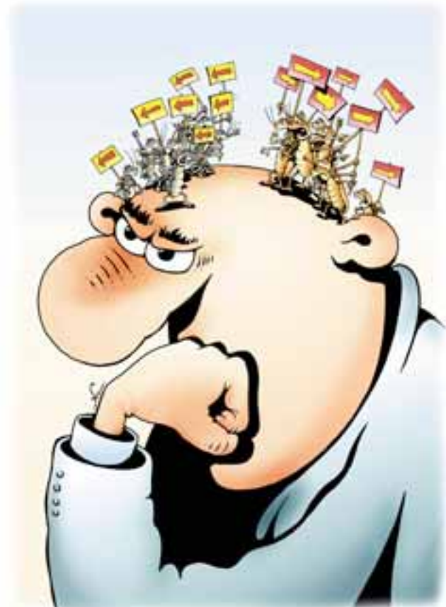
Рисунком Игоря Кийко. www.cartoonbank.ru

Он напомнил, что такие попытки региональная власть предпринимала регулярно, но успехом они не увенчались. Политик надеется, что замыслы Игоря