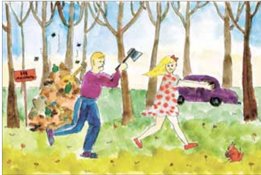
Рисунок Анны Бабкиной

Наша картина мира в значительной степени сформирована СМИ. Телеканалы, газеты, информагентства рассказывают о самых важных событиях. Особенность российской журналистики в том, что зачастую «самым важным» становится самое плохое. Любой несчастный случай или преступление автоматически приобретают значимость, достаточную для того, чтобы рассказать о них широкой аудитории.