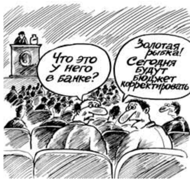
Леонид Мельник, www.cartoonbank.ru

Верхний предел государственного долга области прогнозируется на 1 января 2014 года в сумме 26 млрд рублей, на 1 января 2015 года – 33 млрд рублей, а на 1 января 2016 года – около 40 млрд рублей. Ежегодное обслуживание кредитов выльется в ежегодную трату почти мил-