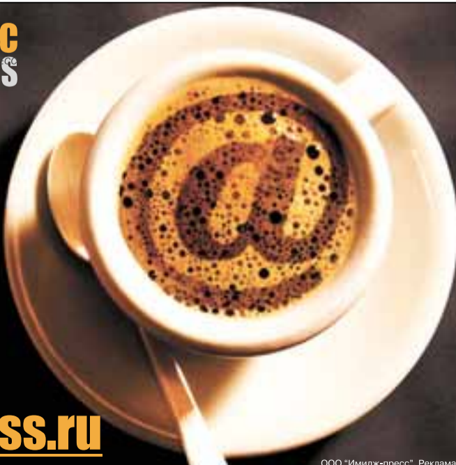
ООО «Имидж-пресс». Реклама.