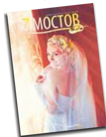
ИП Липницкий А.С. Реклама

Хотите полистать? Сделайте заказ на сайте www.7mostov.info