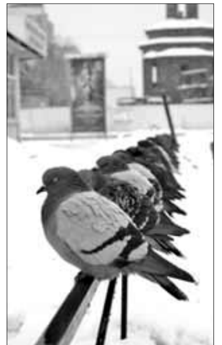
Номинация «Во время сна», 1 место, команда «Zombie».