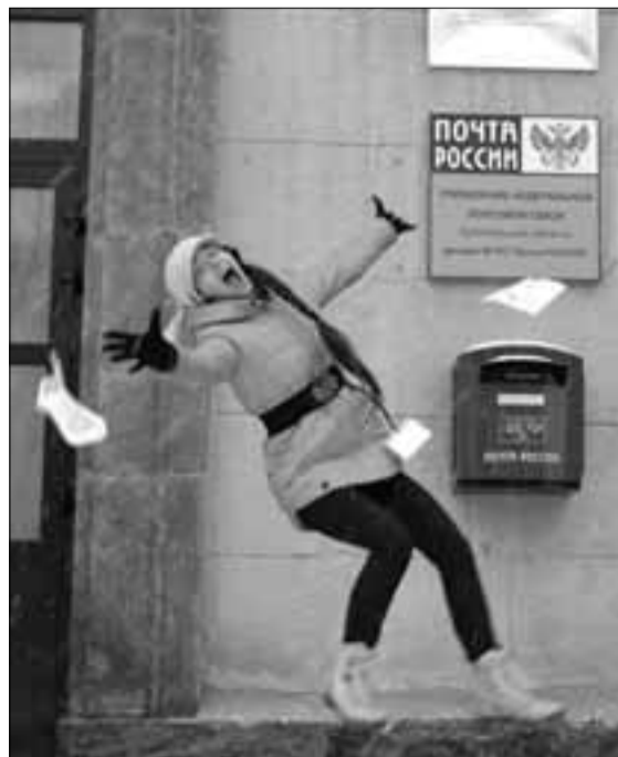
Номинация «Открытые письма», 1 место, команда «Белый мишка».