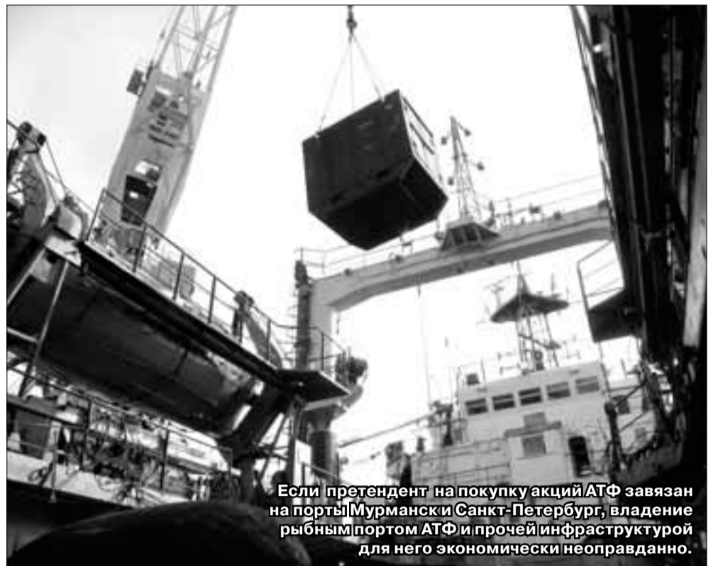
Если претендент на покупку акций АТФ завязан на порты Мурманск и Санкт-Петербург, владение рыбным портом АТФ и прочей инфраструктурой для него экономически неоправданно.

Федеральная антимонопольная служба удовлетворила ходатайство ООО «Вирма» (Петрозаводск) о получении согласия на приобретение 100% голосующих акций ОАО «Архангельский траловый флот». Сейчас предприятие принадлежит государству, но компания стоит в плане приватизации федерального имущества на 2011–2013 гг.