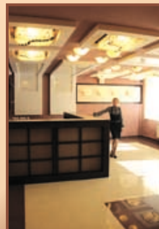
Реклама ООО «Новый век».