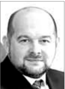
Игорь ОРЛОВ, губернатор Архангельской области