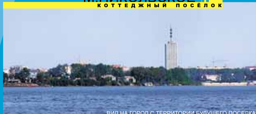
ВИД НА ГОРОД С ТЕРРИТОРИИ БУДУЩЕГО ПОСЕЛКА