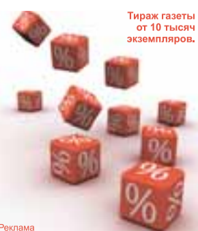
Тираж газеты от 10 тысяч экземпляров.

Заклучив договор с редакцией «Бизнес-класса» до 31 мая, вы получите дополнительную скидку на размещение рекламы в летний период.