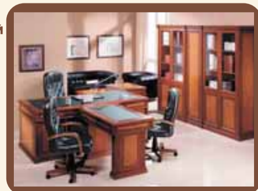
* Районы доставки уточняйте у оператора. Реклама

163000, г. Архангельск, ул. К. Либкнехта, 8/1